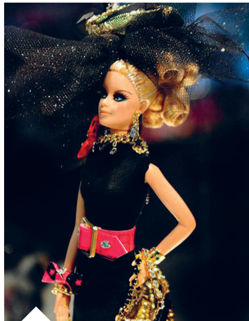
... to nie można się oprzeć wrażeniu, że jest niewiarygodnie sztuczny.

rzy się okazja. Spoglądnięcie na własną, znajomą twarz utwierdza o własnej tożsamości, stąd też większość ludzi ingeruje w to, jak wygląda. Za pomocą ubioru, makijażu czy fryzury dostosowujemy się do aktualnie panującej mody na piękno lub wręcz przeciwnie, odchodzimy od kanonu piękna, chcąc wyrazić naszą indywidualność. Na niektóre rzeczy w naszym wyglądzie nie mamy jednak wpływu, podczas dojrzewania ciała i twarz zmienia się. Te zmiany mogą być pożądane jak np. kobieca figura lub niepożądane tak jak trądzik. Starzenie się niestety idzie w parze z nieporządanymi zmianami w naszym wyglądzie.