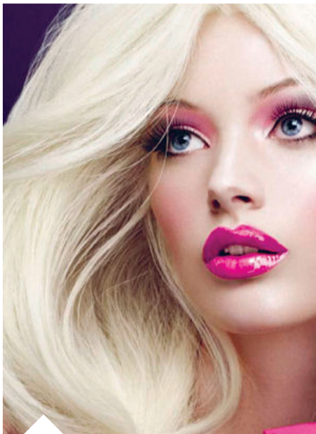
Nie da się ukryć, że dzisiejszy kanon piękna, choć jest niewątpliwie uroczy...

Pierwsze prawdziwe szklane lustro zostało wynalezione w Wenecji w 1460 r. po czym szybko zyskało popularność w Europie. Przeglądamy się w lustrze tysiące razy w czasie naszego życia. Większość z nas przegląda się w lustrach oraz wystawach sklepowych kiedy tylko nada-